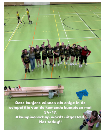
Deze kanjers winnen als enige in de competitie van de komende kampioen met 24-17. #kampioenschap wordt uitgesteld. Not today!!

De meiden B2 speelde afgelopen zaterdag een wedstrijd tegen de koploper in de competitie. De koploper staat een aantal punten los van de nummer twee dus een kampioenschap leek onvermijdelijk, maar daarbij hadden ze niet gerekend op onze MB2. Dankzij goed samenspel en knappe doelpunten wonnen onze MB2 met 24-17. Een mooie beloning voor een erg goede wedstrijd!